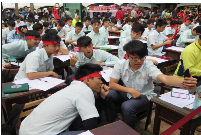
105 年「臺中好日子・性平大會考」-青年學生們考前自拍，互相打氣