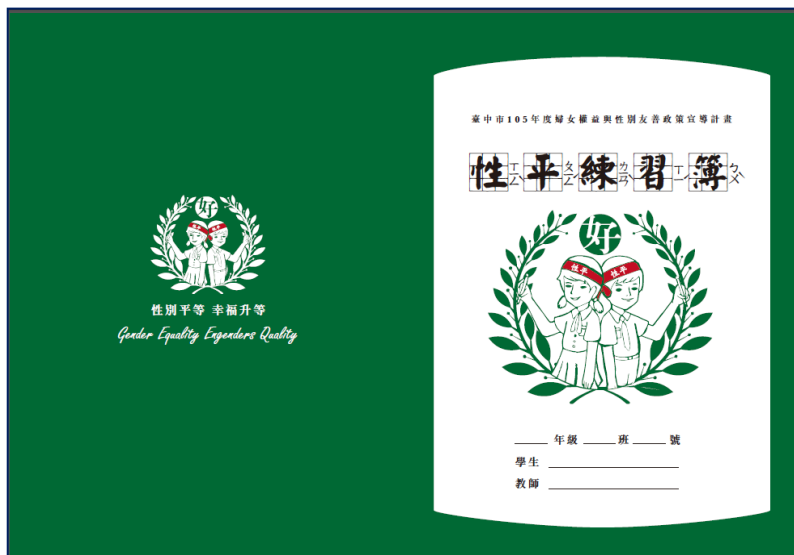
懷舊復古的「性平練習簿」(封面)