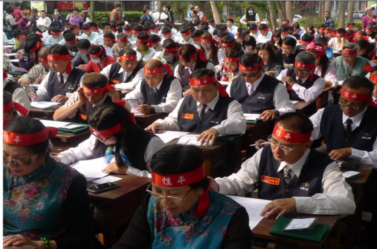
105 年「臺中好日子・性平大會考」-臺灣大車隊的司機們團體報名參加