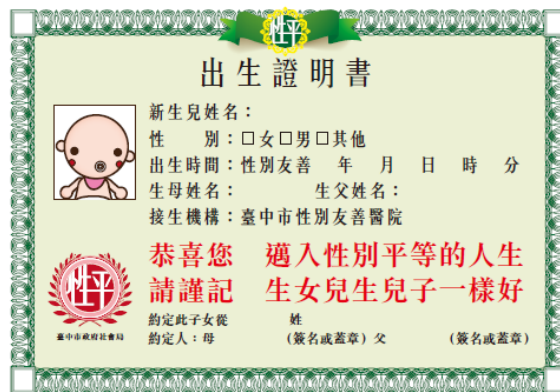
104年宣導品「性平證書·幸福認證」(出生證明)(衛生局)