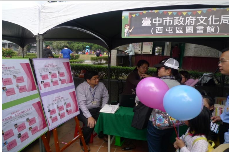
105 年「臺中好日子・性平大會考」-攤味闖關 I