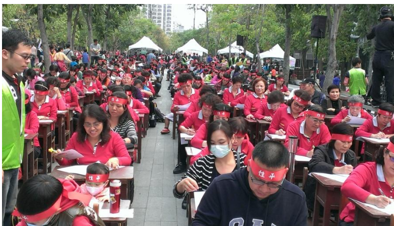
首辦「臺中好日子·性平大會考」-活動參與盛況