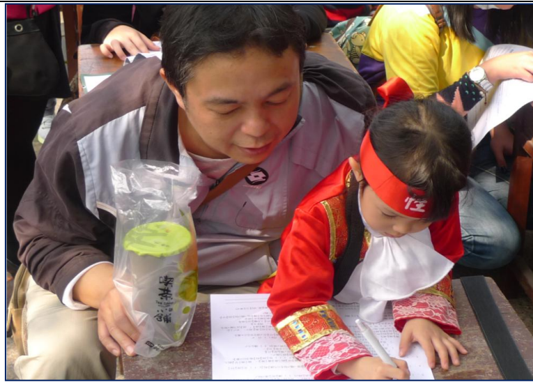
105 年「臺中好日子・性平大會考」-父女共同參與考試，學習性平