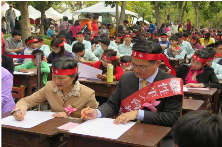
104年「臺中好日子·性平大會考」-長官振筆疾書寫考卷