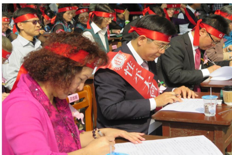
105年「臺中好日子·性平大會考」-長官振筆疾書寫考卷