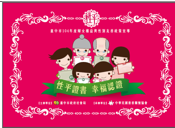
104年宣導品「性平證書·幸福認證」(封面)