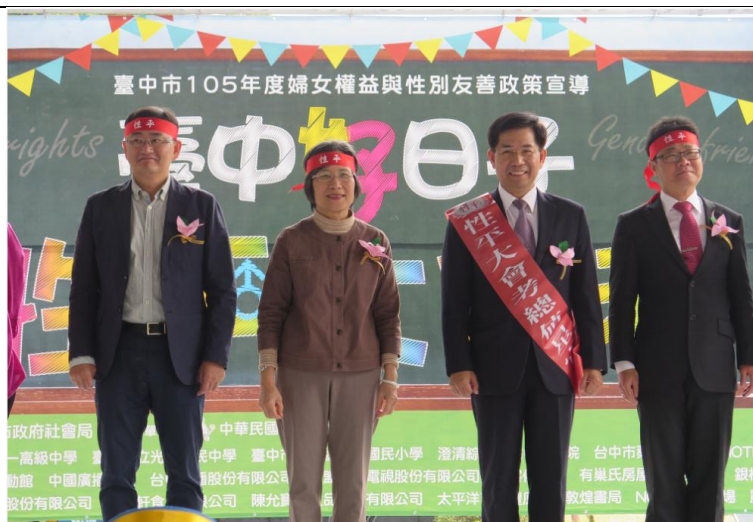
105年「臺中好日子·性平大會考2」-臺中市副市長與各局處出席與會，推動性平