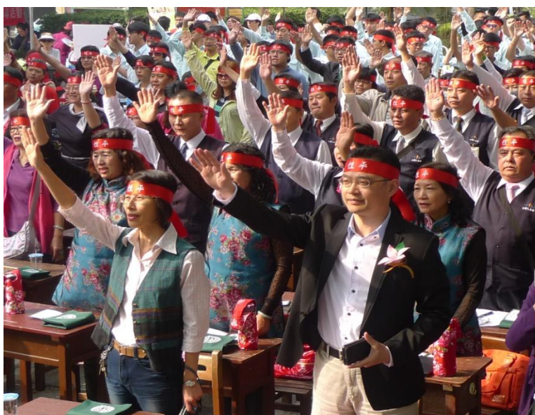
105年「臺中好日子·性平大會考」宣示落實性別平等