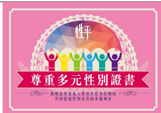
104年宣導品「性平證書·幸福認證」(尊重多元性別證書)