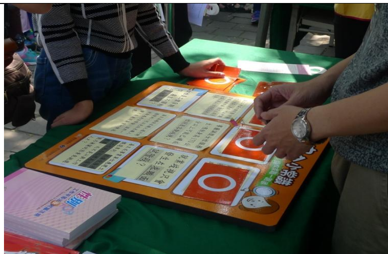
105 年「臺中好日子・性平大會考」-攤味闖關 II