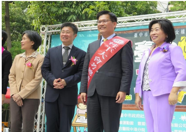
104年「臺中好日子·性平大會考」-臺中市市長與各局處出席與會，推動性平