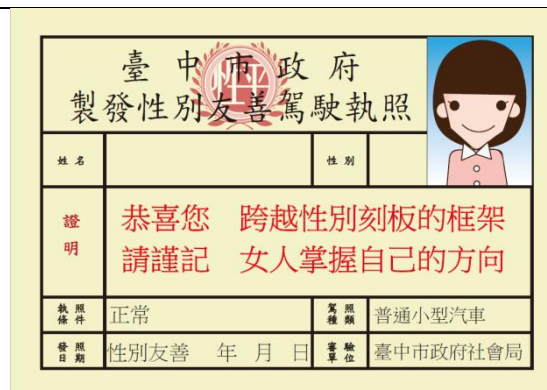
104年宣導品「性平證書·幸福認證」(駕照)(交通局)