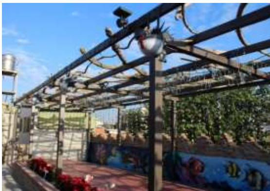
【大安區】西安社區 109 年施作成果→

有關近 2 年辦理臺中市社區規劃師，就 29 行政區之提案分布區域說明，依參與提案排序，烏日區為參與數最高之行政轄區，次為潭子區，中區近來因老屋更新則較無參與之社區。其次，城鄉均衡發展(弱勢區域)部分，於 109 年度已突破蛋黃區，如大安區龜殼社區及西安社區均提案施作且成果顯著。