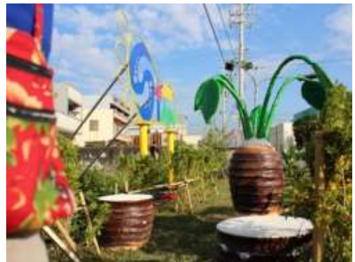
←【大安區】龜殼社區 109 年施作成果