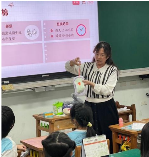
教師示範衛生棉承接經血的狀態