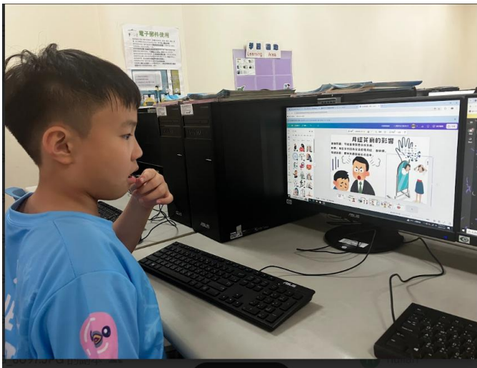
學習後，學生上線製作簡報