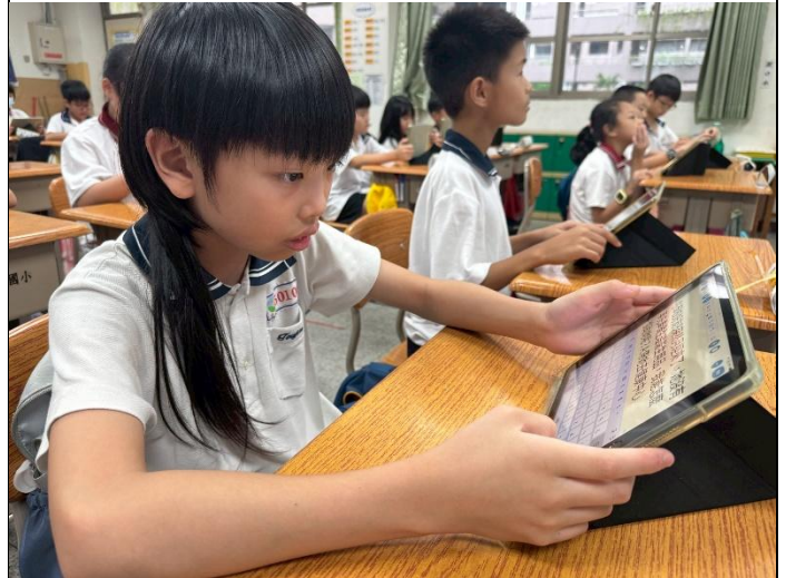
學生透過載具學習