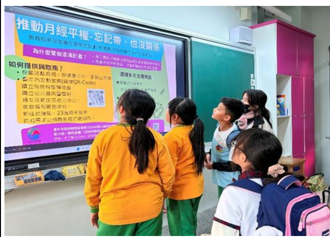
說明：軍功國小於課堂上進行月經平權宣導。