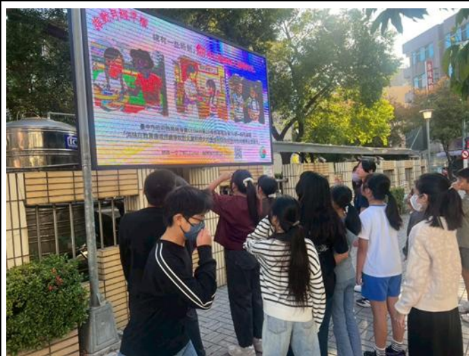
說明：松竹國小學生駐足觀看推動月經平權教育宣導海報。