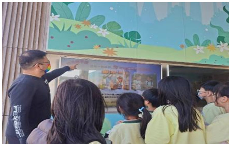
說明：春安國小老師在穿堂張貼海報並介紹本市推動月經平權政策及措施。