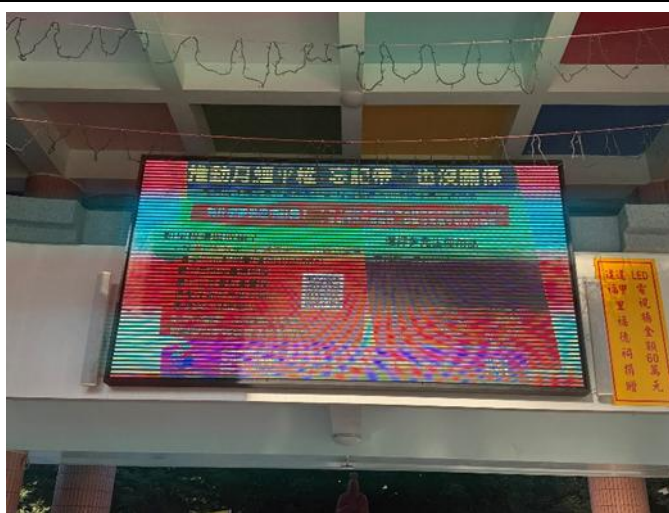
說明：西屯國民小學利用電視牆進行 CEDAW 月經平權宣導。