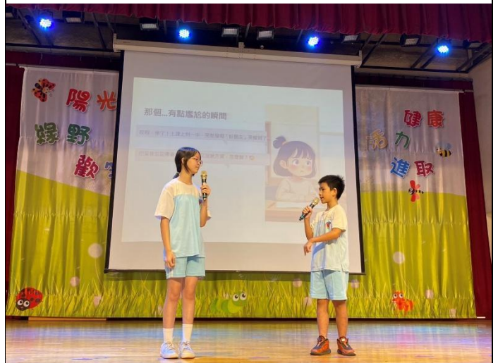
教師安排接受課程的班級學生，利用集會向全校進行月經平權宣導。