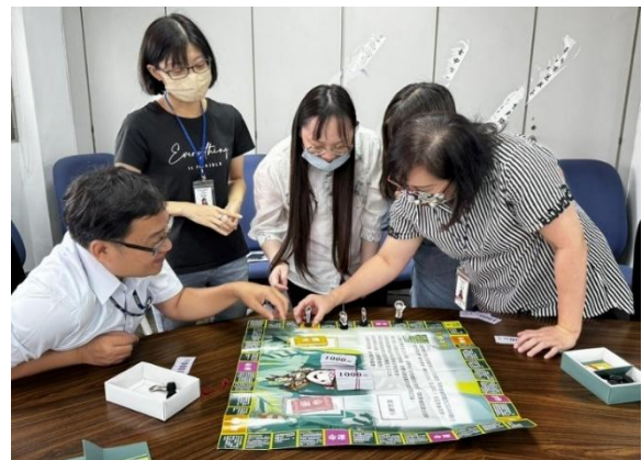
大安區公所辦理性別意識培力課程進行桌 遊互動