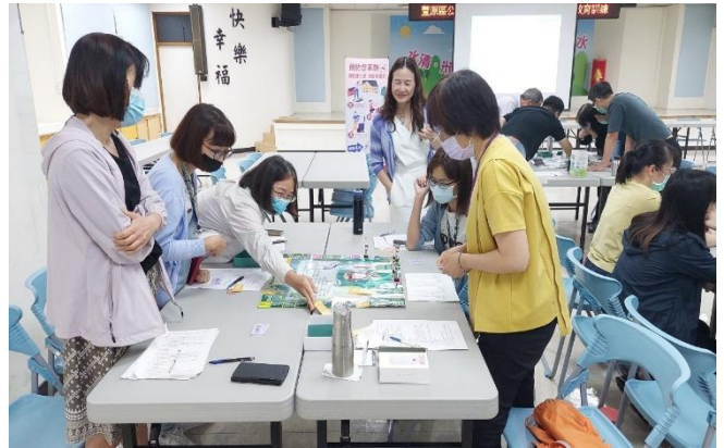
豐原區公所辦理性別培力課程進行桌遊