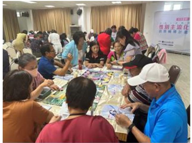
勞工局辦理推動工會團體性別主流化政策 輔導計畫進行桌遊