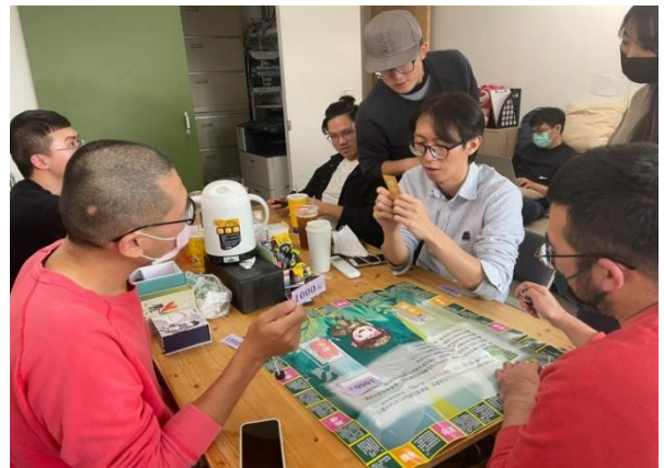
社團法人台灣基地協會辦理跨性別聚會進行桌遊