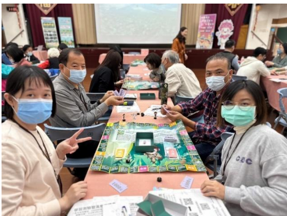
西區區公所辦理性別意識培力課程進行 桌遊互動