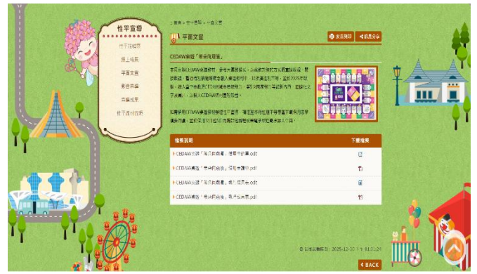
希朵桌遊借用單下載路徑：臺中市政府性別平等專區→性平宣導→平面文宣