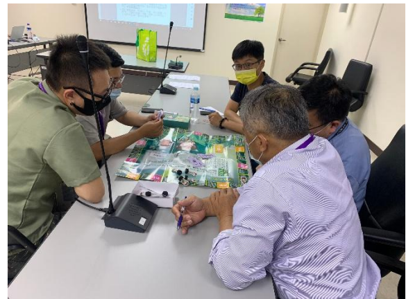
都發局辦理性別意識培力課程進行桌遊