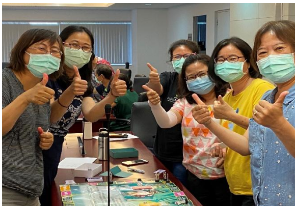
民政局辦理性別意識培力課程進行桌遊