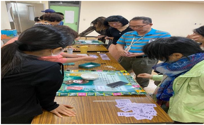
潭子區公所辦理性別培力課程進行桌遊