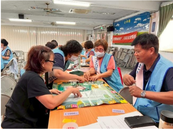
太平區公所辦理民政業務聯繫會報進行桌遊