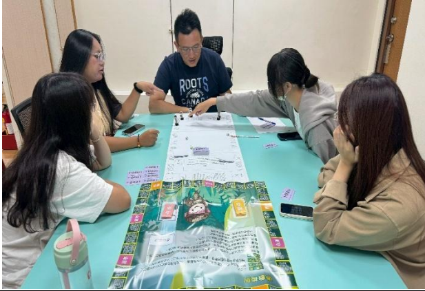
社會局婦平科辦理團體督導進行桌遊