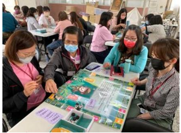
后里區公所辦理民政志工聯誼活動進行桌遊