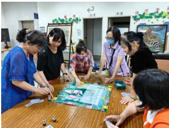
太平區興隆社區發展協會辦理婦女第二專長培訓-性平講座進行桌遊