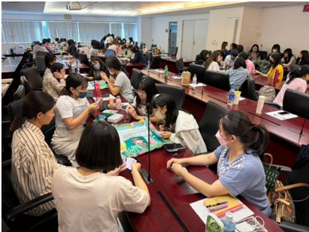
人事處辦理推動年輕公務女力充能研習 進行桌遊