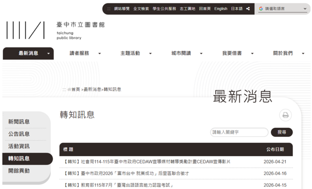
市立圖書館總館於官網放置 CEDAW 媒材宣傳影片