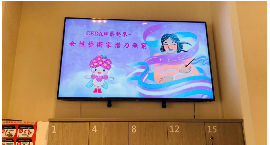
纖維工藝展演中心於官網、大廳輪播器播放 CEDAW 媒材宣傳影片