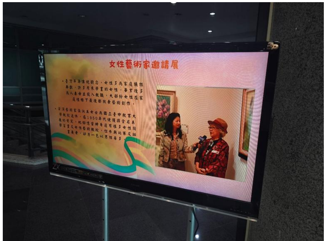
屯區藝文中心於大廳電視牆播放 CEDAW 媒材宣傳影片