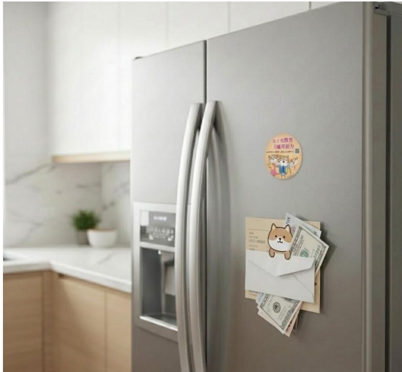
照片 5：冰箱貼使用示意圖