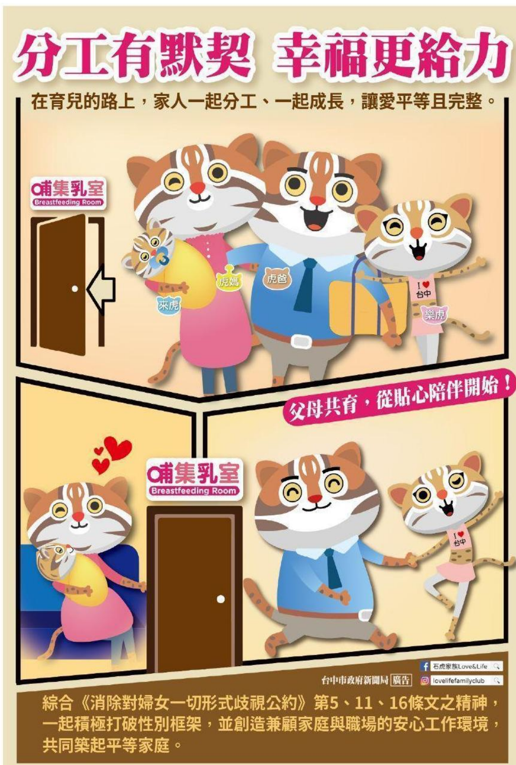
照片 1：CEDAW 海報