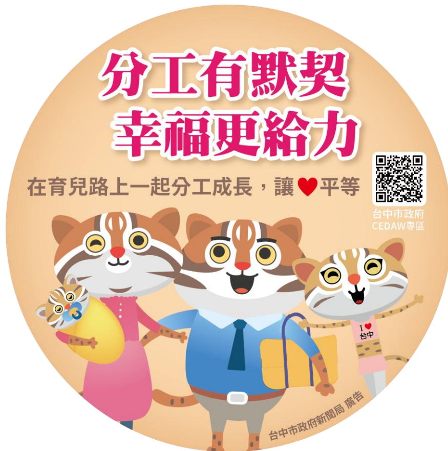
冰箱貼規格：直徑 6 公分